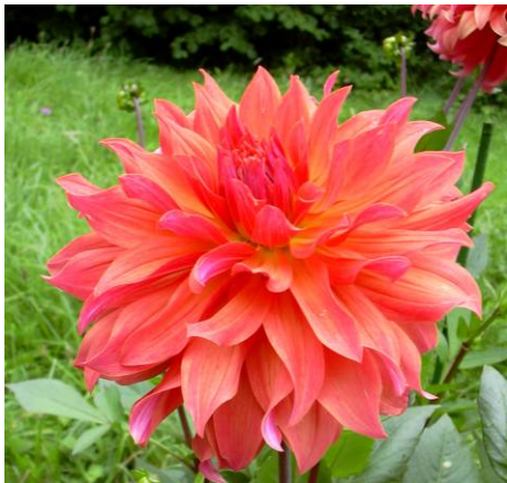
Alauna Chamade, décoratif informel au coloris chaud et subtil non photographiable.

Décoratif informel (ou hybride) : fleur pleine présentant des ligules pas toutes refermées dans le même sens ou plus ou moins bouclées (ce qui n'est pas synonyme), à l'extrémité ronde ou pointue, larges ligules ou non.