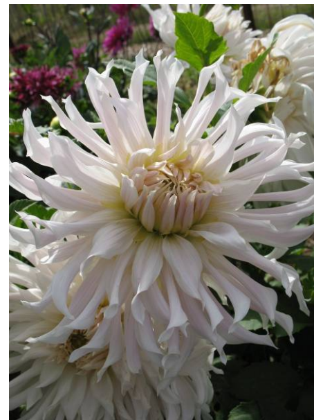
Silver Wedding, cactus incurvé (ex-récurvé)

Cactus incurvé : cactus dont les ligules tubulées se courbent latéralement (comme un tourbillon, on parlait jadis de cactus récurvé) ou se recourbent vers le centre de la fleur (on les appelait déjà incurvés).