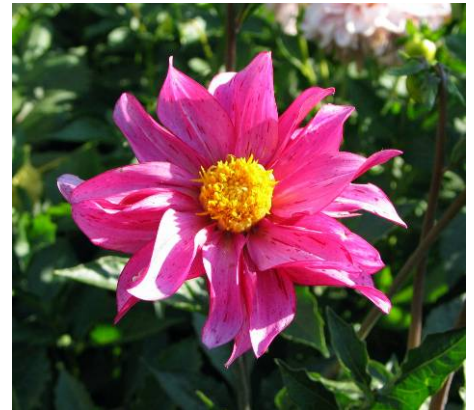
Kancia, fleur de pivoine panachée