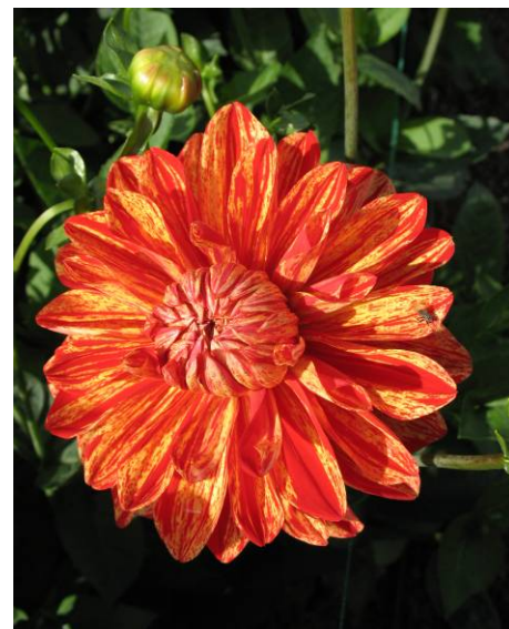
Néo, obtention panachée des Ets Ernest Turc, Prix du public à Mainau et révélation à Coutances