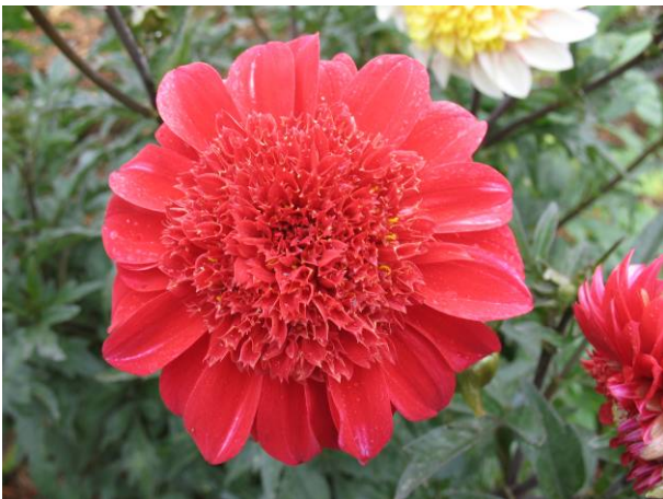
Riverdance, à fleur d'anémone d'une seule couleur

Orchette : (catégorie récente) fleur à centre ouvert ayant un rang de ligules se refermant dans le sens concave pour montrer le revers des ligules (comme les fleurs d'orchidée) et un groupe de pétales colorés à la base de chaque ligule (comme les collerettes).