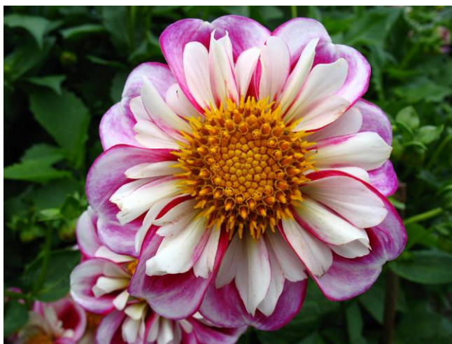
Bumble Rumble, à large collerette, tout en rondeur, distribué par Jeanne de Laval