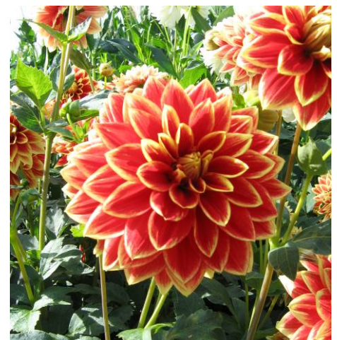
Caballero, décoratif formel récent aux ligules rouges ourlées de jaune

Fleur d'anémone : fleur présentant un ou plusieurs rangs de ligules externes développées et un groupe de ligules centrales colorées mais soudées en tubes et de taille réduite formant comme un rucher.