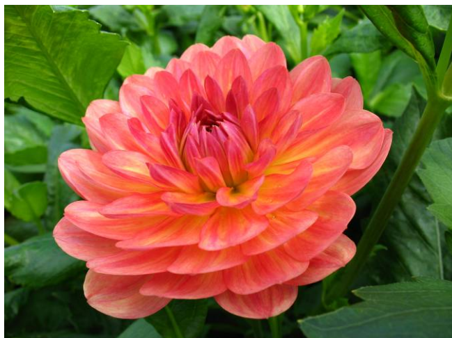
Valbonne, beau camélia à Coutances