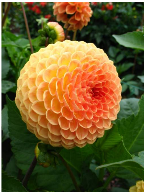
Blyton Softer Gleam à Coutances et Vincennes

Après toutes ces manifestations, expositions et concours, voici un panel des variétés primées ou particulièrement remarquées.