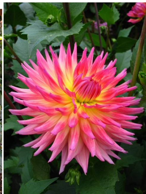
Karma Sangria, un des meilleurs cactus jaune à pointes roses pour le jardin et la fleur coupée