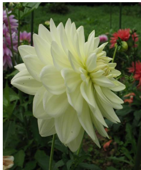
Cameo, fleur de camélia blanc crème

Fleur de camélia : forme très proche d'un décoratif formel avec certaines restrictions : ligules absolument plates (ni recourbées, ni ondulées) et larges, fleur peu épaisse (moins de la moitié du diamètre).