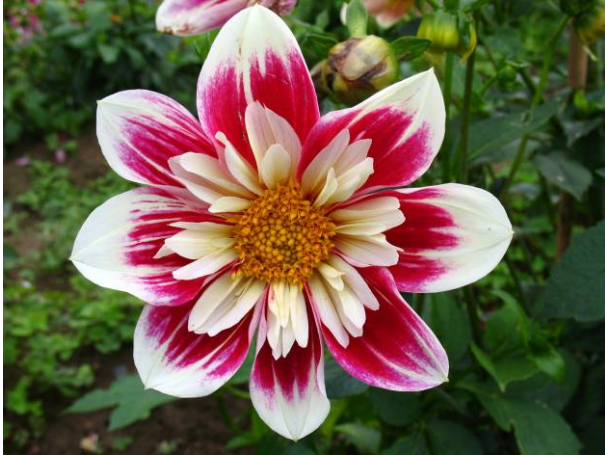
Fashion Monger, dahlia collerette

Collerette : fleur à centre ouvert ayant un rang de ligules plus ou moins plates et plus ou moins pointues ou échancrées avec à la base de chaque ligule un groupe de pétales (ligules peu développées) colorés.