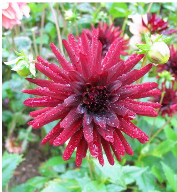
Nuit d'été, ancien petit cactus droit français

Cactus : fleur pleine dont les ligules se referment sur toute leur longueur dans le sens convexe pour ne montrer que leur face supérieure (ligules turbinées), larges ligules ou non.