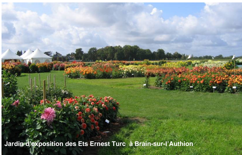
Jardin d'exposition des Ets Ernest Turc à Brain-sur-l'Authion