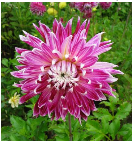
Vancouver, fleur de chrysanthème, sport pourpre d'Akita en rouge et or et frère de Vanaka en jaune panaché de rouge