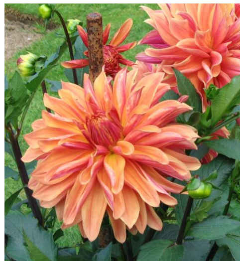
Caméléon, étoilé à revers marbré