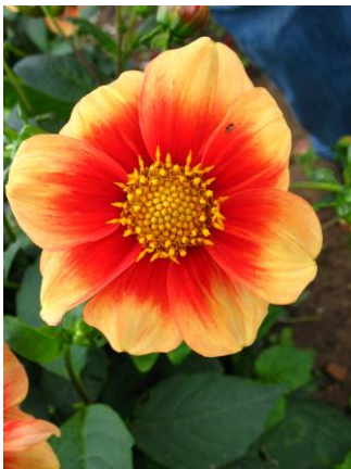
Schloss Reinbek, simple bicolore

Enfin, la classification fait référence au caractère centre plein (sans cœur fertile visible) ou à centre ouvert (fleur dite creuse), les dahlias doubles étant généralement à cœur plein jusqu'à un stade relativement avancé d'épanouissement. Certains dahlias doubles ne montrent jamais de cœur ; ils sont donc stériles. Quant le cœur est visible, ce sont des fleurs unitaires fertiles, plus ou moins jaune orangé et sans pétales colorés et développés que l'on aperçoit.