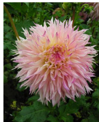
Pinelands Princess, décoratif lacinié

Balle : Dans les formes rondes voici le grand (diamètre supérieur à 6 cm), fleur à centre plein dont les ligules sont totalement refermées dans le sens concave (à la limite, les deux bords se chevauchent ou sont soudés), ensemble rond, extrémités des ligules rondes et non pointues ni échancrées