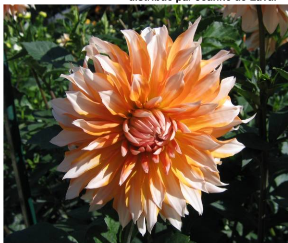
Apelsini Sniega au conservatoire grâce à nos échanges avec la Lettonie et à Vincennes où il a reçu le deuxième prix toute catégorie et le troisième prix du public