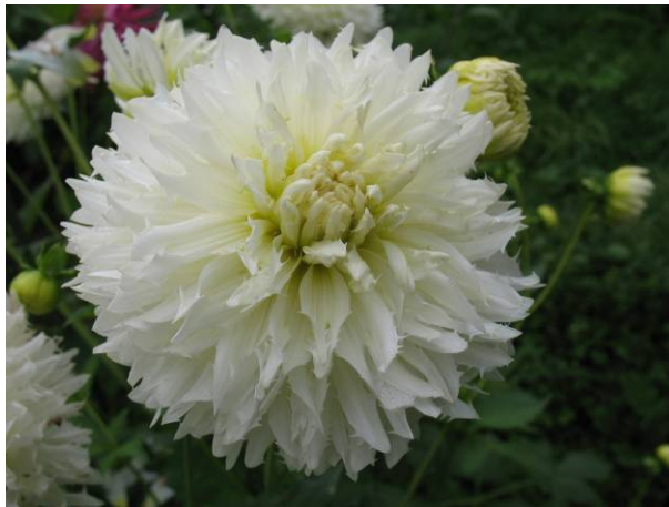
Horse Feathers, nouveauté aux ligules échancrées sur le côté