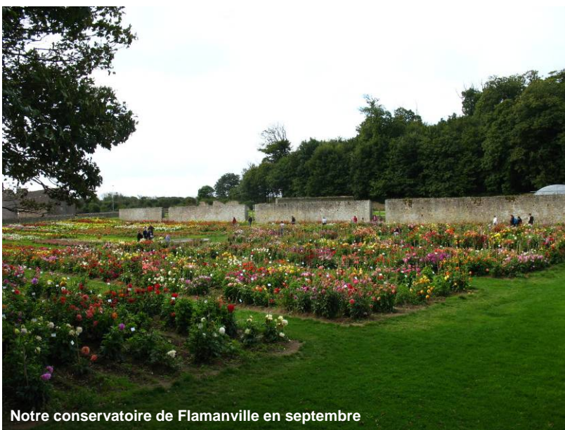
Notre conservatoire de Flamanville en septembre

Le label rouge se précisait. Notre président faisant entendre sa voix à propos des critères de jugement, du choix des variétés et de la reconnaissance de son action d'amateur auprès des professionnels.