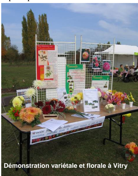
Démonstration variétale et florale à Vitry