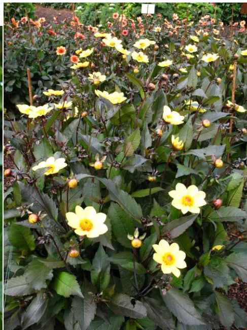
Happy Single Party, dans une série de simples à feuillages pourpres, souvent en potée fleurie