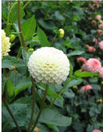
Small World, pompon blanc et Cornel, balle rouge uni, deux variétés idéales pour les bouquets

Pompon : Dans les formes rondes voici le petit (diamètre inférieur à 6 cm), fleur à centre plein dont les ligules sont totalement refermées dans le sens concave (à la limite, les deux bords se chevauchent ou sont soudés), ensemble rond, extrémités des ligules rondes et non pointues ni échancrées.