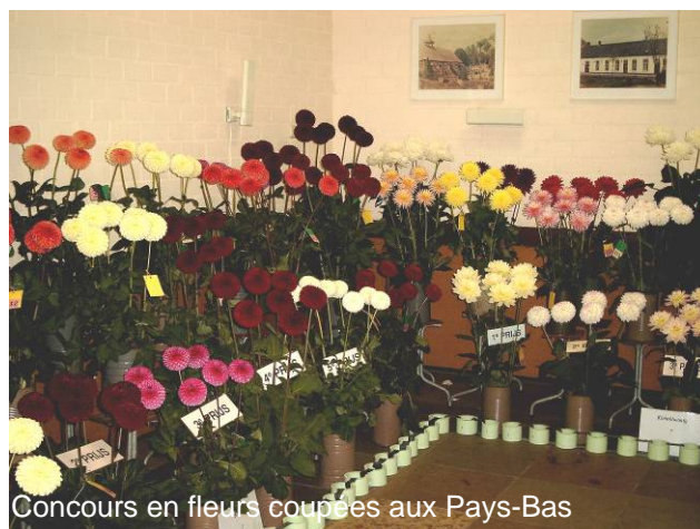
Concours en fleurs coupées aux Pays-Bas