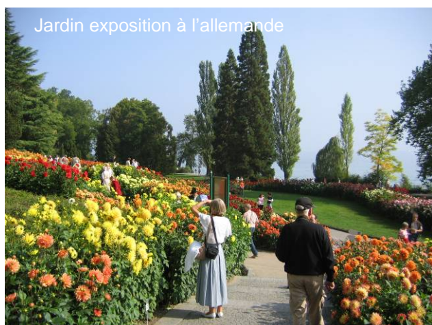
Jardin exposition à l'allemande